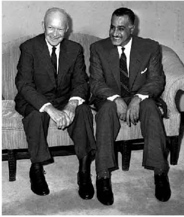
مع الرئيس الأمريكي أيزنهاور

وأكد الرئيس أن مصر - رغم ذلك - قررت الدفاع عن سيادتها وأراضيها ضد العدوان الفرنسي البريطاني المنتظر. وقد طلب الرئيس من السفير أن يبلغ الرئيس أيزنهاور رسالة من الحكومة.